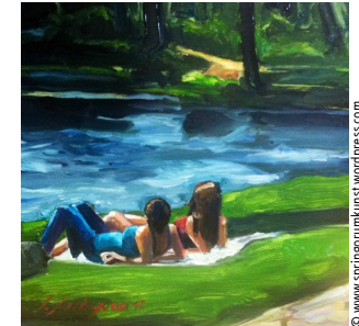
Silvia Springorum, Sonnenbad im Park (20 cm x 20 cm, Öl auf Holz, 2013)

„Kommt alle zu mir, die ihr euch plagt und schwere Lasten zu tragen habt. Ich werde euch Ruhe verschaffen. Nehmt mein Joch auf euch und lernt von mir; denn ich bin gütig und von Herzen demütig; so werdet ihr Ruhe finden für eure Seele. Denn mein Joch drückt nicht und meine Last ist leicht.“ (Matthäusevangelium, Kapitel 11, Verse 28 bis 30)