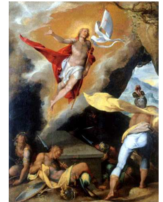
Bartholomäus Spranger, Auferstehung Christi (1576)

Dies Osterbild von Bartholomäus Spranger ist durchzogen von einer ungeheuren Dynamik; die beiden wehenden Mäntel sind geradezu ergriffen von dem himmelwärts strebenden Sog, der das Bild beherrscht. Aber wo ist eigentlich der Himmel, dem der auferstehende Christus entgegenstrebt? Fast hat man den Eindruck, er befinde sich bereits darin; in der goldgelben Wolke nämlich, in der er schwebt - oder steigt er doch empor? Aber hier findet keine Himmelfahrt statt, schließlich stehen wir in einer Gruft und nicht auf einem Berg. Der Menschensohn steht auch nicht auf und setzt sein bisheriges Leben fort wie einst Lazarus. Nein, Auferstehung ist viel mehr: Jesus steht auf in eine andere, in eine neue Wirklichkeit. Und unser hoffnungsvoll-ungläubiger Osterjubiläum ist nichts anderes als die Ahnung dieser neuen Wirklichkeit, die wir mit Augen noch nicht schauen können. -