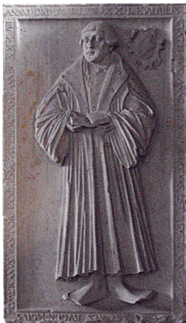
Johannes Bugenhagen (24. 6. 1485 – 20. 4. 1558) Grabsteinplatte in der Wittenberger Stadtkirche

Johannes Bugenhagen, nach seiner Heimat auch Doktor Pommer genannt, Stadtpfarrer von Wittenberg, war Luthers Beichtvater und hat ihm in den Zeiten der Anfechtung immer wieder göttlichen Trost zugesprochen. Viel hat er für sein „großes“ Beichtkind, für die Universität und für das Werk der Reformation gebetet und darüber bisweilen Ort und Zeit vergessen, so dass man ihn zur Predigt auf die Kanzel rufen musste. Im Pestjahr 1527 hielt er in Wittenberg aus, versorgte Kranke und Sterbende und wuchs in diesem Liebesdienst aufs engste mit Martin Luther zusammen. An der Bibelübersetzung hat er wacker mitgearbeitet und ihre Vollendung alljährlich am 21. September mit seiner Familie festlich begangen.